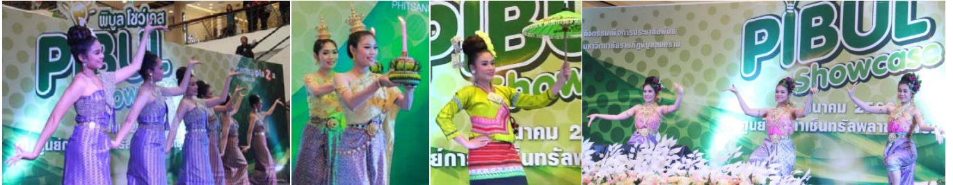
การแสดงจากสำนักศิลปะและวัฒนธรรม