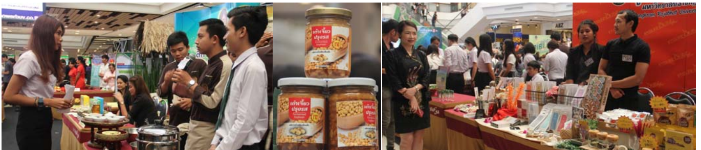
การจัดบูธนิทรรศการ จากคณะและหน่วยงานต่างๆ