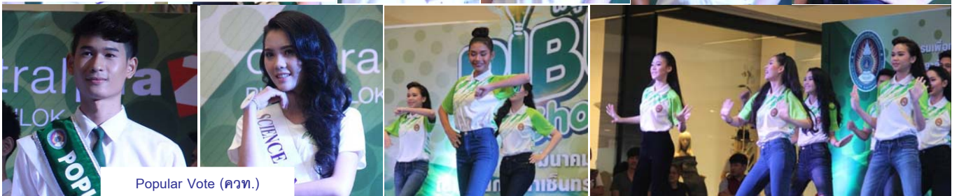
Popular Vote (คทอ.)