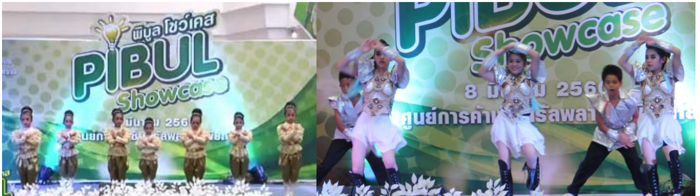
การแสดงจากโรงเรียนสาธิต มรพส.