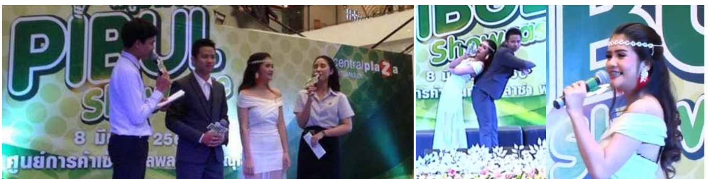
การแสดงจากคณะครุศาสตร์