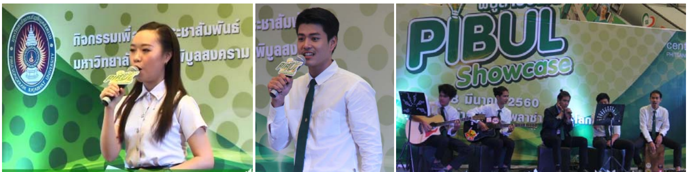
การแสดงจากคณะมนุษยศาสตร์และสังคมศาสตร์