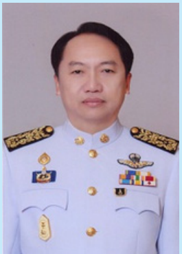
หมายเลข ๕