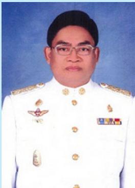
หมายเลข ๒