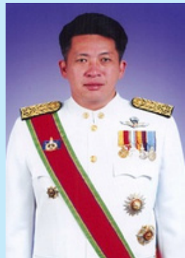
หมายเลข ๓